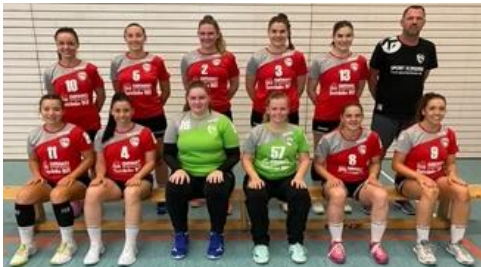
Frauen 1 Baden-Württemberg Oberliga